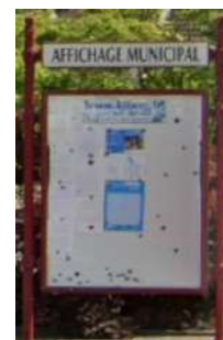
Affichage en face de la mairie