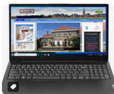
www.killem.fr sur votre ordinateur ou tablette

Pour connaître l'actualité de votre commune