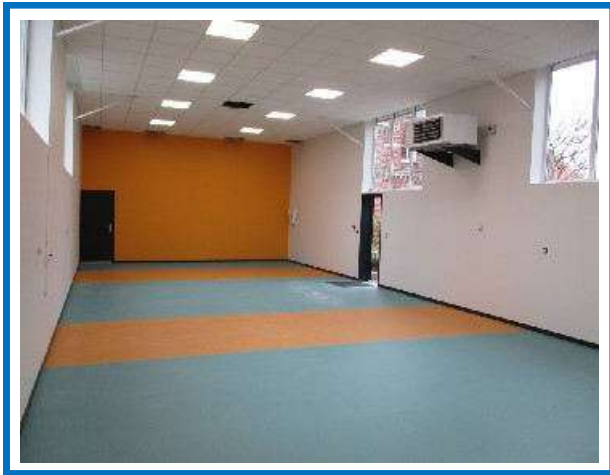
la salle du patronage

Pour cette année scolaire, l'effectif de l'école est de 148 élèves répartis sur 7 classes, ce qui nous donne donc un effectif par classe qui ne dépasse pas les 25 élèves.